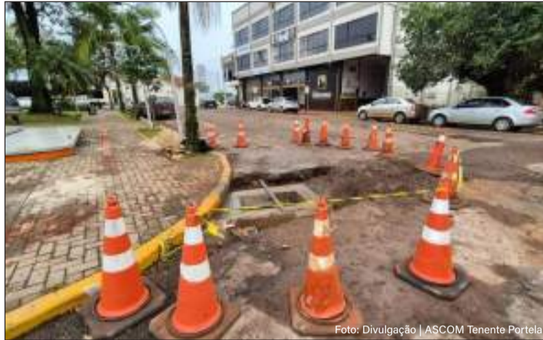
Substituição da tubulação no entorno da Praça Tenente Bins

de do revestimento nos percursos recuperados. Além disso, haverá modificações na rede elétrica dos serviços se concentram no trecho que liga a Praça do Imigrante até a