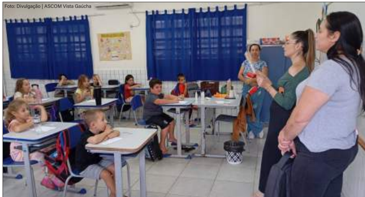
Proposta do programa é trabalhar a prevenção e a promoção da saúde de maneira conjunta com a educação

A Mostra Macrorregional integra o Programa Saúde na Escola. Por meio do PSE são efetuados trabalhos nos educandários de forma integrada, envolvendo equipes multiprofissionais e fortalecendo o vínculo com a comunidade escolar.