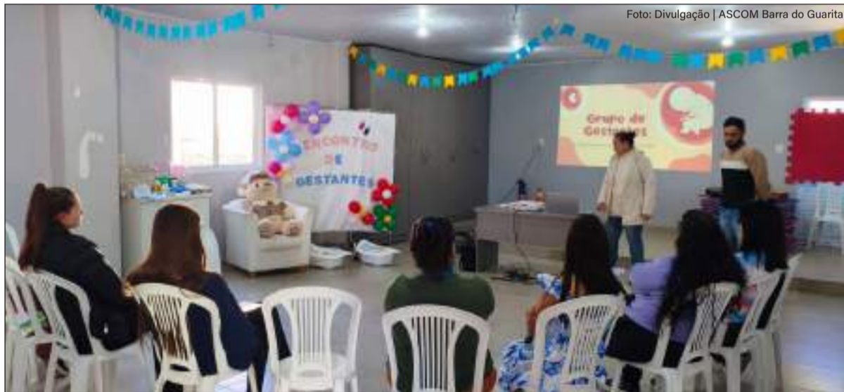
Programação foi elaborada para sanar as principais dúvidas das participantes

A programação foi elaborada para sanar as principais dúvidas das participantes, focando em assuntos como: importância do pré-natal - o acompanhamento regular para garantir a saúde da mãe e do feto;