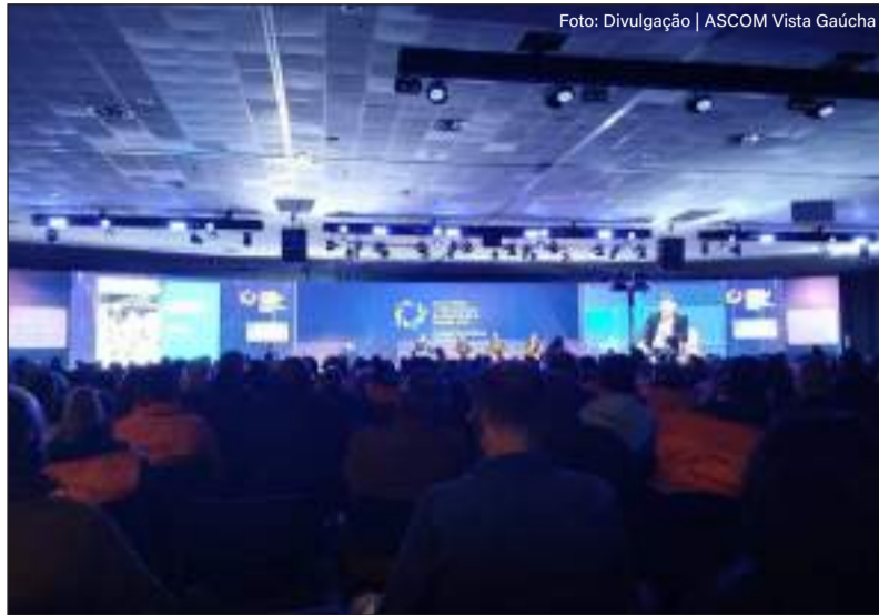
Evento pautou estratégias de prevenção e resposta diante de desastres naturais

O Congresso Internacional de Proteção e Defesa Civil, que ocorreu entre os dias 23 e 25 de junho, em Porto Alegre, reuniu especialistas, autoridades e representantes de órgãos de proteção e defesa civil do Brasil e de países como Itália, Argentina e Equador.