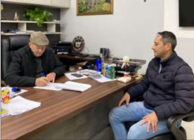
Autoridades destacaram a relevância dos investimentos para as localidades

Secretaria de Desenvolvimento Urbano e Metropolitano do Rio Grande do Sul. O ato ocorreu no gabinete do Centro Administrativo e assegurará o repasse de R$ 648.525,13 para investimentos em infraestrutura nas comunidades do interior.