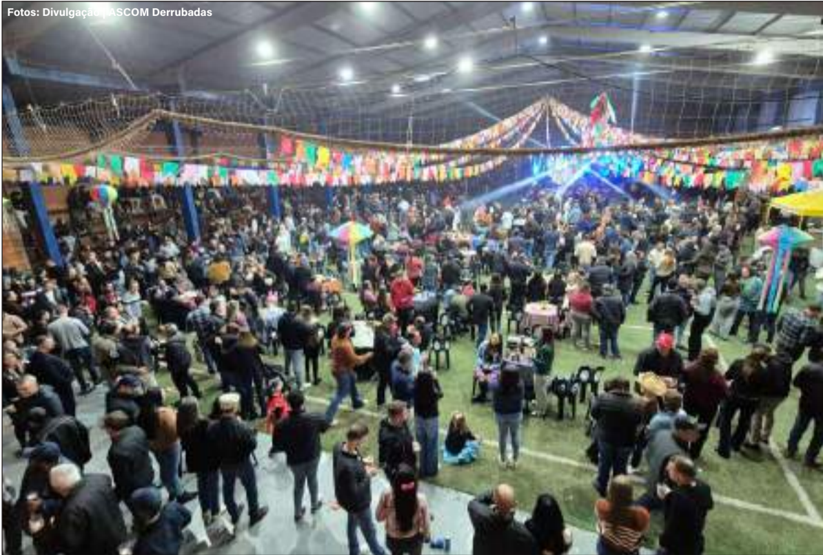
Festa Junina Municipal reuniu a comunidade local e regional em uma programação marcada pela valorização da cultura

A IX Festa Junina Municipal reuniu a comunidade local e regional na noite de sábado (20/6), em uma programação marcada pela valorização da cultura popular, participação das escolas e momentos de integração entre famílias, estudantes e educadores.