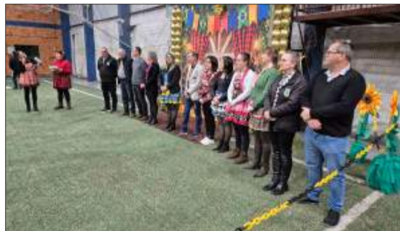
Protocolo de abertura do evento

A Festa Junina Municipal, consolidada como uma das principais celebrações do calendário cultural de Derrubadas, mantém vivas as tradições populares. Além disso, fortalece os vínculos comunitários e proporciona momentos de convivência e valorização da cultura local.