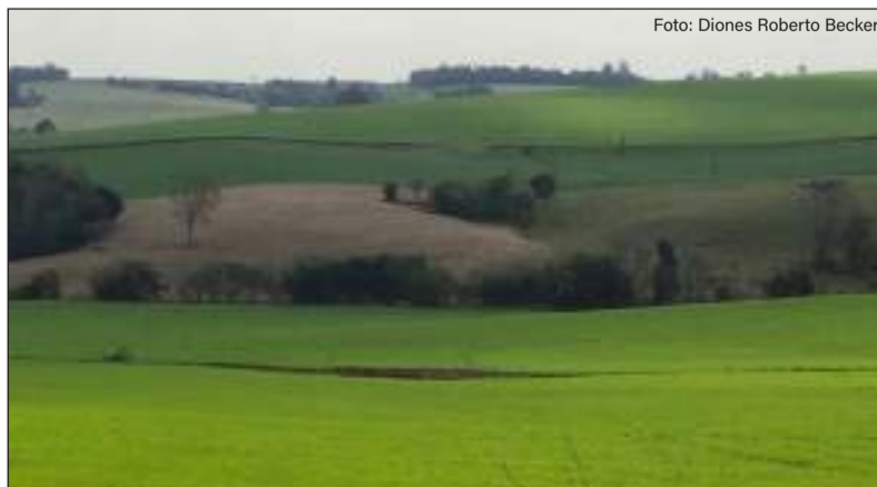
Semeadura do trigo avançou na maior parte das regiões produtoras

maior percepção de risco climático para o ciclo de inverno. Também se observa redução do nível tecnológico em parte das áreas, como racionalização do uso de insumos e maior utilização de sementes salvas.