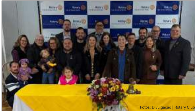
Transmissão de cargo representa o começo do ano rotário 2026/2027

do espírito de servir e reafirma o compromisso dos rotarianos de continuar fazendo a diferença na comunidade, fortalecendo os valores de companheirismo, ética e solidariedade.