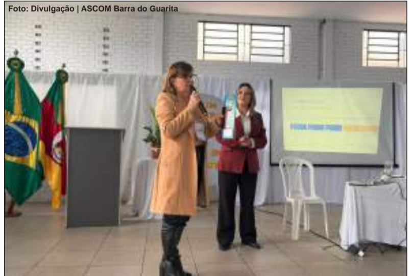
Evento propiciou momentos para diálogos e construção coletiva das metas