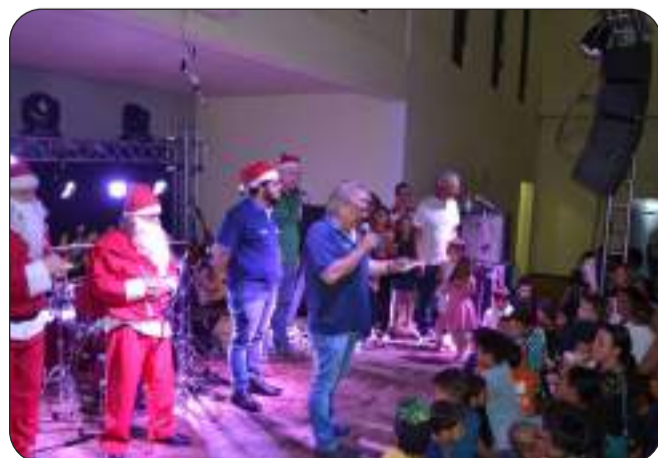
Natal da Criança Carente é realizado há mais de 30 anos

do Sul. O projeto nasceu de uma convicção: era possível fazer, no interior, uma comunicação moderna, comunitária, regional e comprometida com a informação. Na época, abrir uma emissora de rádio FM no interior do Estado representava um grande desafio. O rádio