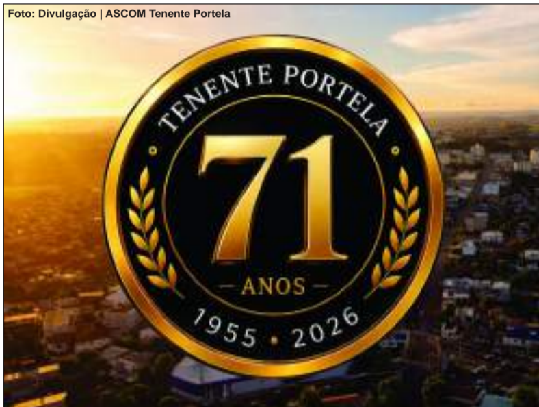
No evento também foi lançado o selo oficial dos 71 anos de emancipação