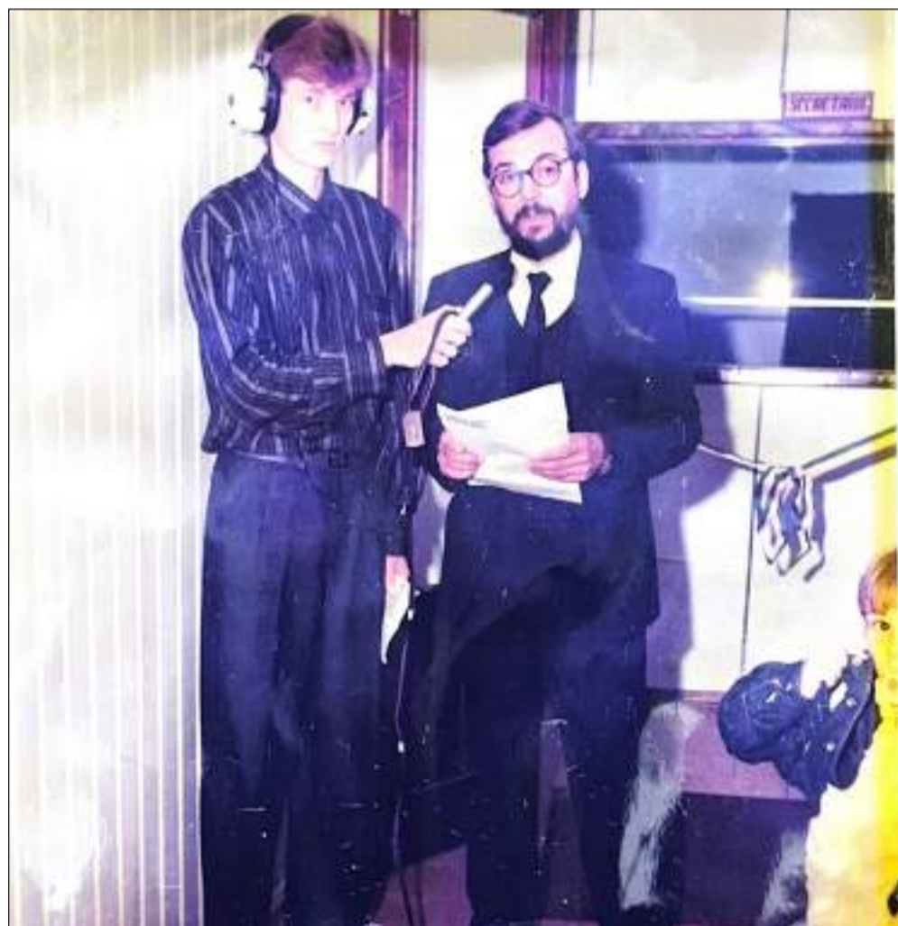
Inauguração da Rádio Província FM de Tenente Portela em junho de 1989

A Rádio Província FM chega aos 37 anos reafirmando seu compromisso com a informação, a cultura, a prestação de serviço, a solidariedade e o desenvolvimento regional. Uma história construída no microfone, nas páginas do jornal, nas ruas, nos eventos, nas campanhas comunitárias e, principalmente, na confiança dos ouvintes.