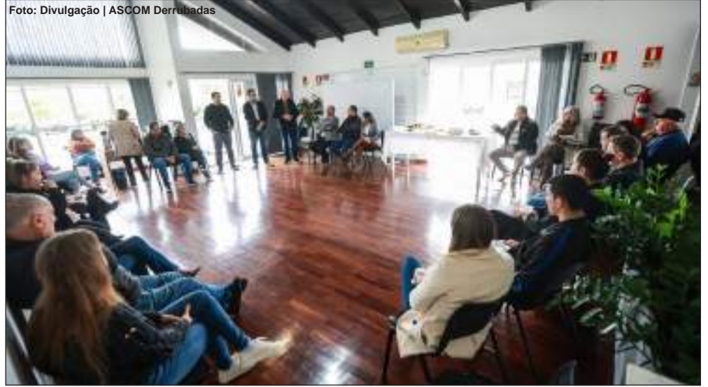
Reunião com o deputado federal Alceu Moreira ocorreu na quinta-feira (11/6)