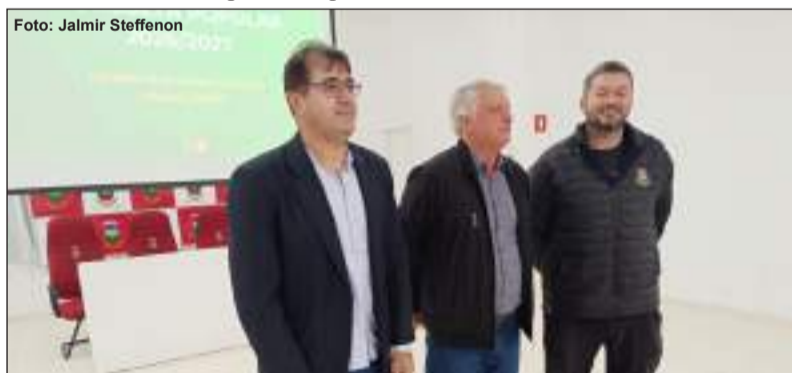
Representantes do Corede Celeiro e da Administração Municipal

a cédula de votação da região – acontecerá em Três Passos, no dia 23 de junho. Na reunião de lançamento da Consulta Popular 2026/2027 no âmbito regional,