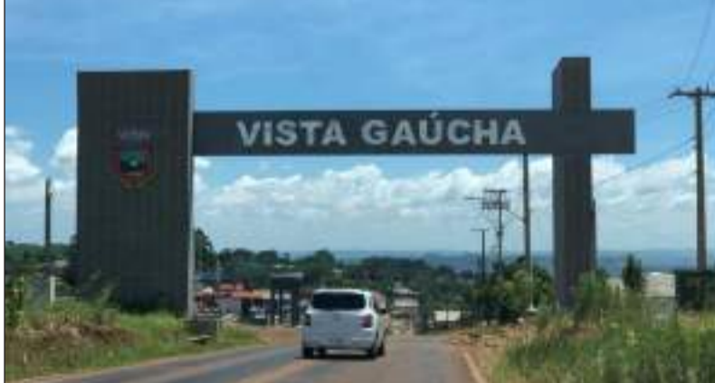
Vista Gaúcha é um dos municípios contemplados com recurso da SDR

da formalização de demandas pendentes de anos anteriores. Foram contemplados 32 municípios, entre eles, Esperança do Sul, Redentora e Vista Gaúcha, situados na Região Celeiro.