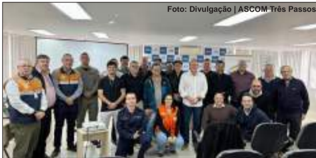
Encontro ocorreu na Amuceleiro, em Três Passos, e teve a participação de autoridades brasileiras e argentinas. Página 4