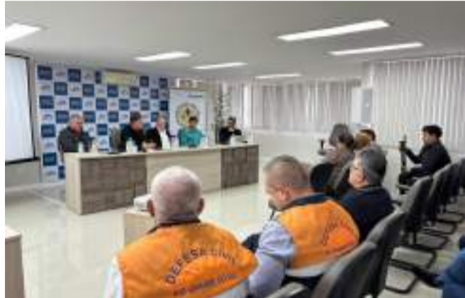
Reunião realizada na Amuceleiro, em Três Passos

O coordenador adjunto da 5ª Coordenadoria Regional de Proteção e Defesa Civil (CREPDEC), capitão