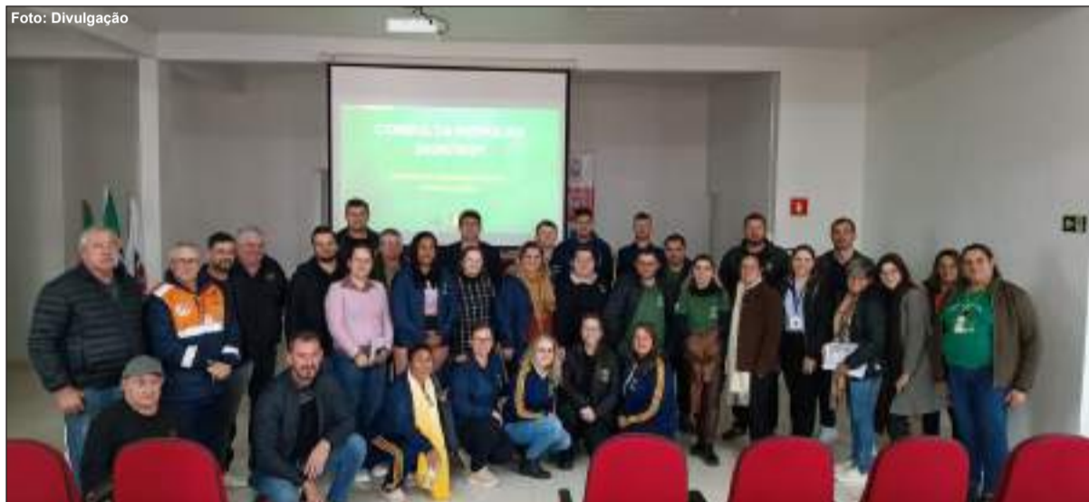
Assembleia intermediária da Microrregião I aconteceu em Vista Gaúcha, na quinta-feira (11/6)

Representantes dos municípios que compõem a Microrregião I do Corede Celeiro reuniram-se, na manhã de quinta-feira (11/6), em Vista Gaúcha, para a primeira assembleia intermediária. O encontro serviu para a escolha dos projetos que serão apresentados na próxima fase da Consulta Popular 2026/2027.