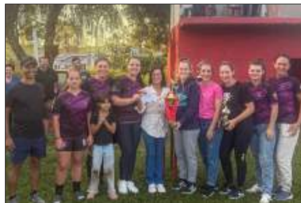
Equipe da Diandra - campeã do feminino