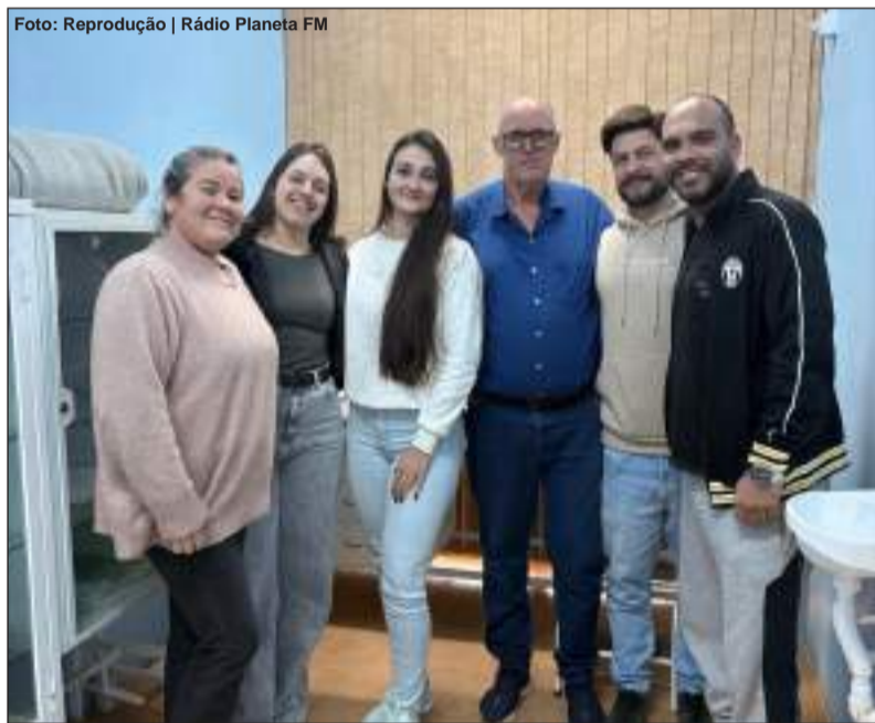
Profissionais atuam na UBS e nas ESFs