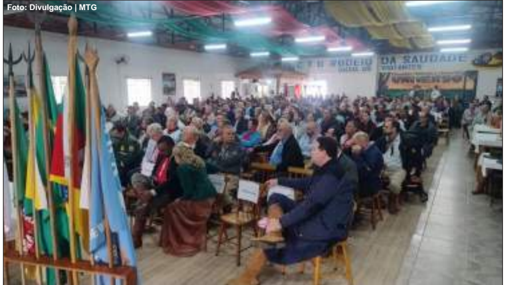
MTG reuniu diretores de cavalgadas das 30 RTs para tratar do acendimento da Chama Crioula

daschi, declarou oficialmente lançado o evento de Geração e Distribuição da Chama Crioula de 2026 em Rio Pardo. Em sua manifestação, ele ressaltou que as cavalgadas exigem organização e responsabilidade, por serem atividades itinerantes realizadas em estradas, acampamentos e diferentes comunidades. Pela segunda vez, o Governo do Estado dará apoio financeiro para a realização do evento e a condução da Chama Crioula.