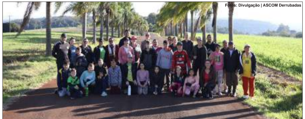
Preservação pautou as ações realizadas na sexta-feira (5/6), data em que se celebra o Dia Mundial do Meio Ambiente