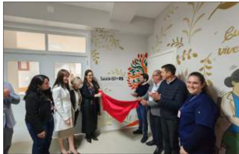
Inauguração do Serviço Especializado de Saúde da Pessoa Idosa (Saúde 60+ RS)

2025. A iniciativa expande o atendimento ambulatorial especializado e regionalizado às pessoas com 60 anos ou mais que apresentem fragilidade funcional ou diag-