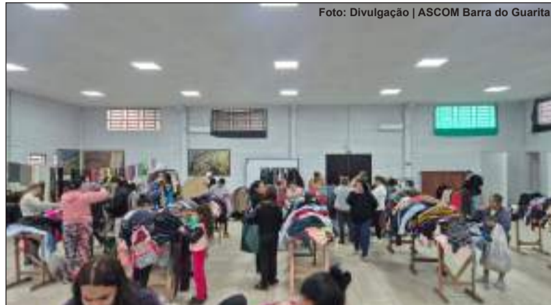
Entrega das peças ocorreu no Centro Comunitário