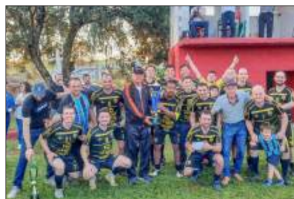
Harmonia - campeão da categoria livre