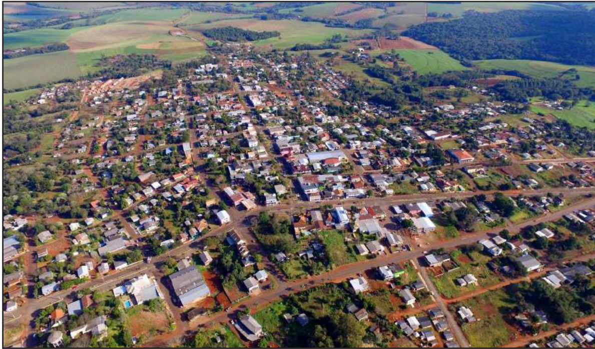
Aprovado na Câmara, prefeito vai passar a receber R$ 19 mil por mês

Quem assumir a prefeitura de Redentora a partir de 1º de janeiro de 2025 terá um dos salários mais altos entre os gestores municipais da região. Uma nova lei, aprovada neste ano, reajustou os subsídios do prefeito e do vice-prefeito, com vigência a partir do próximo ano. Conforme a Lei nº 2.894, de 12 de junho de 2024, o prefeito municipal passará a receber um subsídio mensal de R$ 19 mil, marcando um aumento significativo em relação ao valor anterior.