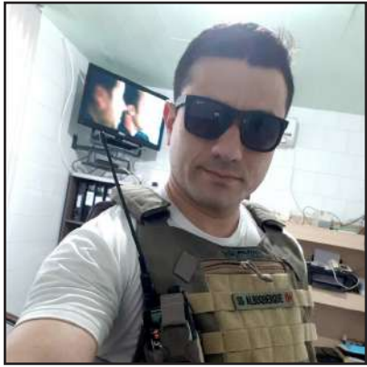
Clairton Albuquerque Policial Militar