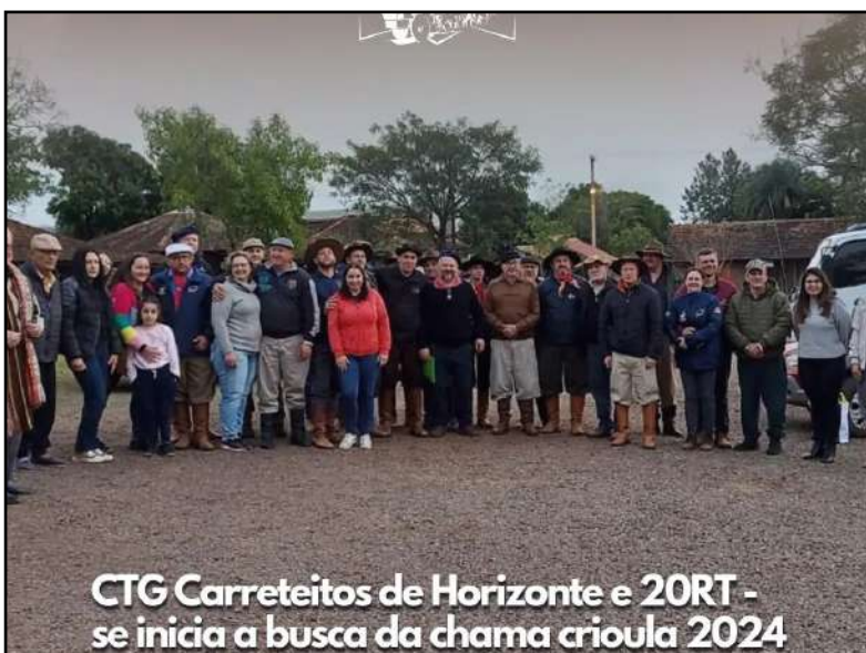
CTG Carreteiros de Horizonte e 20RT - se inicia a busca da chama crioula 2024

Os Festejos Farroupilhas de 2024 terão início oficial na sexta-feira, 16 de agosto, em Alegrete, com o acendimento da Chama Crioula. A cerimônia, que celebra a integração entre Uruguai, Argentina e Brasil, contará com a presença de