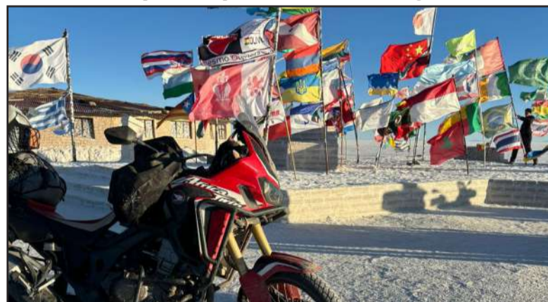
Os motoqueiros saíram do Amazonas e retornaram à região.