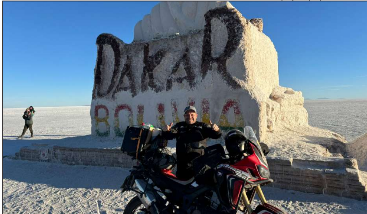
Durante 17 dias, o grupo percorreu 6 mil quilômetros.