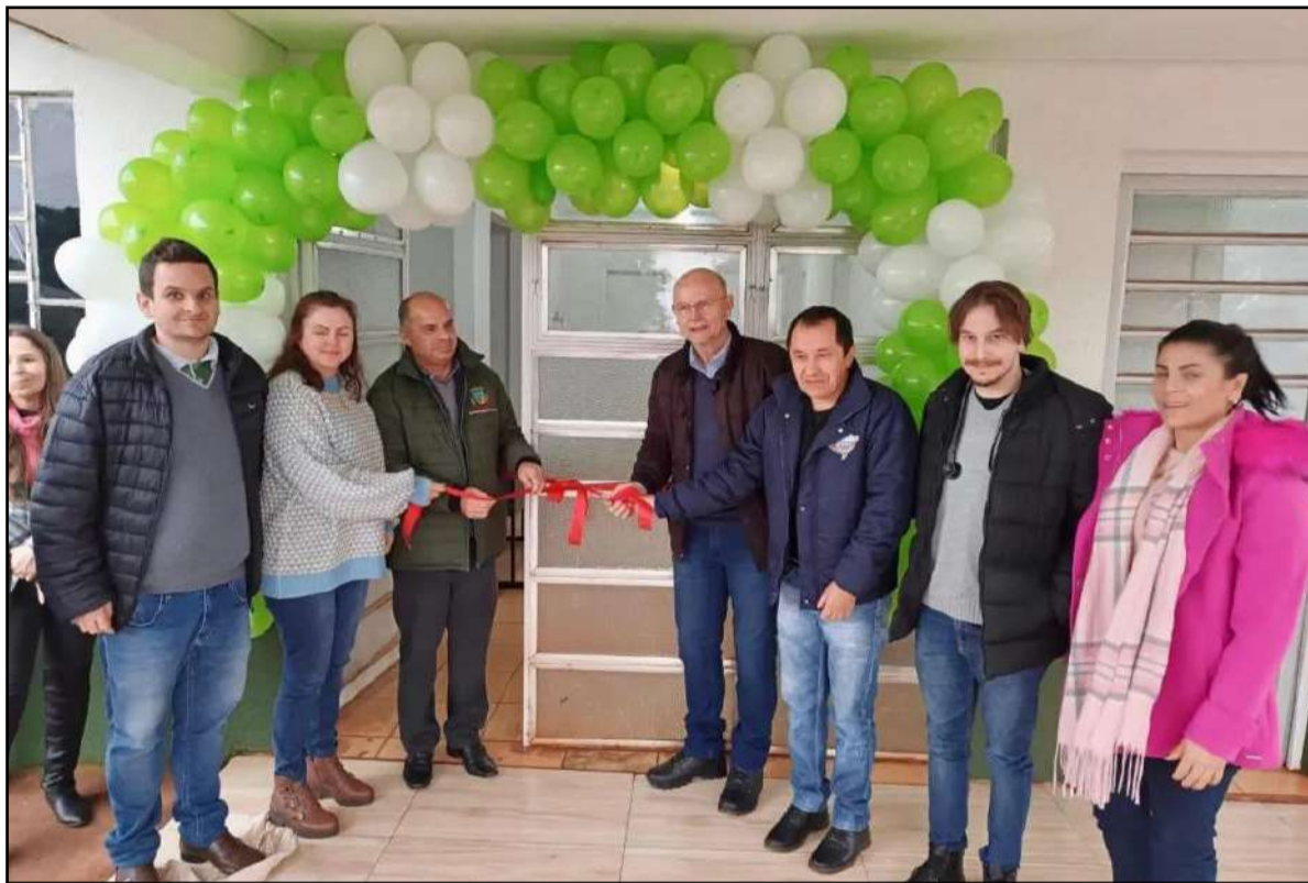
prédio possui ambulatório, farmácia e salas para atendimentos médico e odontológico, entre outros espaços

A reinauguração da Unidade Básica de Saúde (UBS), de Campo Santo, aconteceu na manhã da sexta-feira (28/6). Autoridades locais, moradores, servidores públicos e o deputado federal Elvino Bohn Gass (PT-RS) participaram da solenidade.