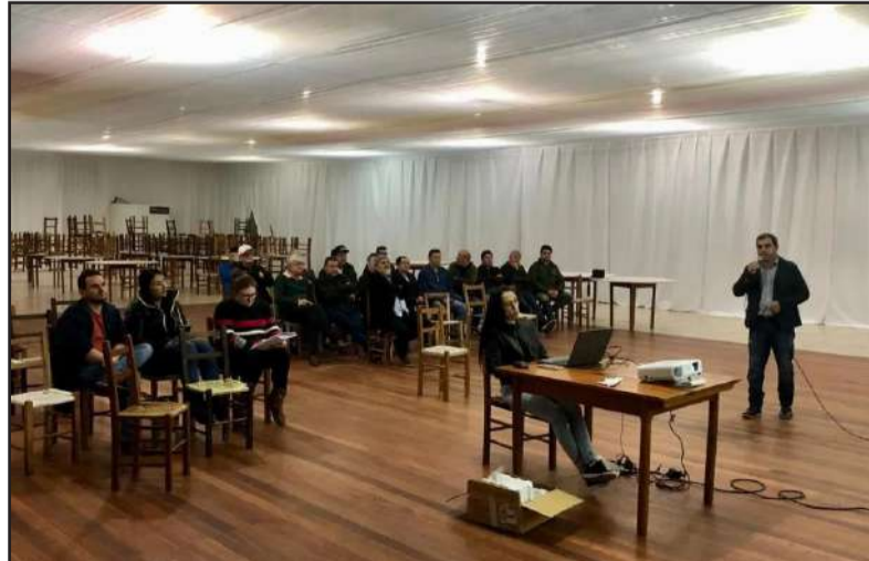
Números foram apresentados durante audiência pública

Números relativos ao período de intervenção administrativa na Associação Hospitalar Santo Antônio de Pádua (AHSAP) foram apresentados