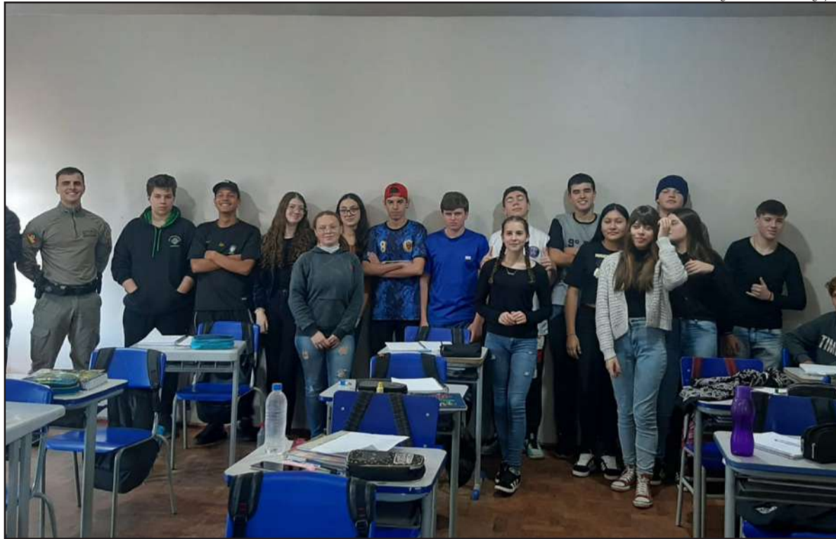
Os alunos passaram pela formação realizada na escola

Na terça-feira, 21 de maio, o Instituto Estadual de Educação Fagundes Varela, de Miraguaí, concluiu o Programa Educacional de Resistência às Drogas e à Violência (PROERD) com as turmas 11 e 12 do Ensino Médio e a turma 11 do Curso Normal.