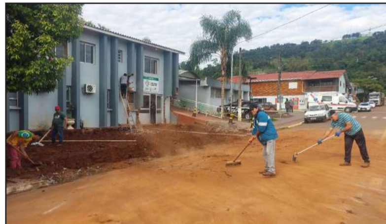
Trabalhos estão sendo realizados no posto de saúde do município

A Administração Municipal de Barra do Guarita está realizando significativos investimentos na ampliação do Posto de Saúde da cidade. Durante esta semana, os trabalhos continuam com a terraplanagem e o início da concretagem do novo pavimento, marcando um importante avanço nas obras.