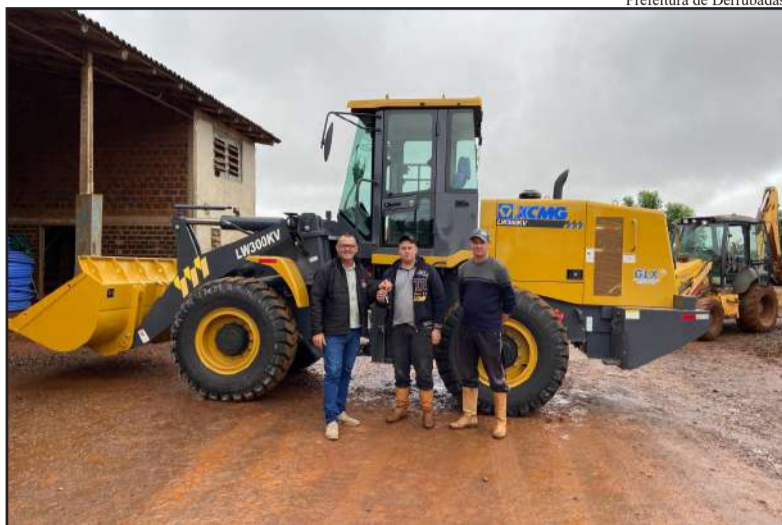
Prefeitura de Derrubadas

Habitzreiter destacou a importância da nova aquisição, afirmando que a pá carregadeira será fundamental para agilizar os serviços realizados pela Secretaria de Obras. A máquina será utilizada em diversas tarefas, como carregamento de materiais, areia, brita, terra e entu-