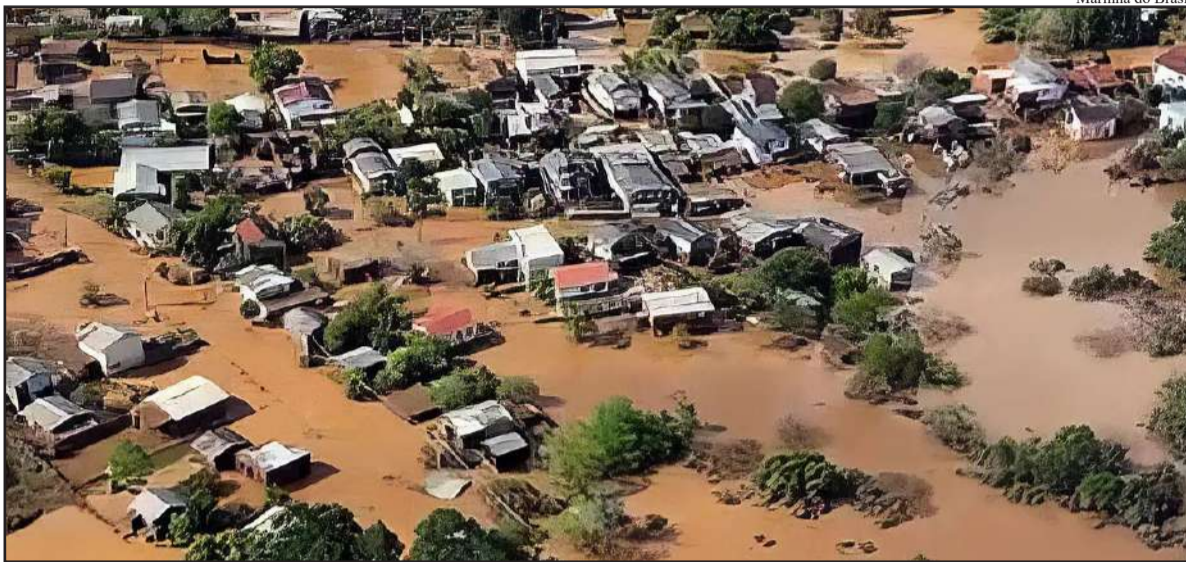
Marinha do Brasil

Enchentes atingiram mais de alguma forma mais de 90% do estado