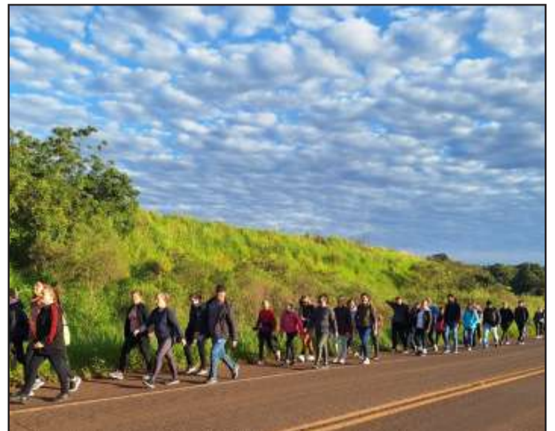
A celebração do centenário dos mártires, que é feriado municipal em Tiradentes do Sul e Três Passos

A prefeitura vai designar uma médica veterinária, para atuar em conjunto com a vigilância sanitária, com encontros periódicos. A intenção é a intensificação da fiscalização.