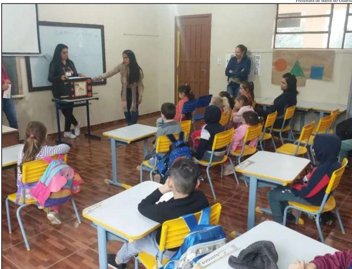
Prefeitura de Barra do Guarita