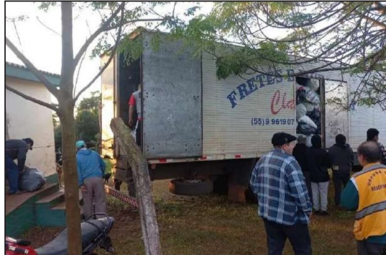
A entrega foi feita no setor de estiva

A Defesa Civil de Redentora, em conjunto com a Administração Municipal, intermediou a doação de um furgão cheio de agasalhos para os moradores da Terra Indígena do Guarita. A solicitação foi feita à 7ª CREPDEC da Defesa Civil, na segunda-feira, dia 20 de maio, e no mesmo dia foi obtida a liberação para a retirada dos agasalhos,