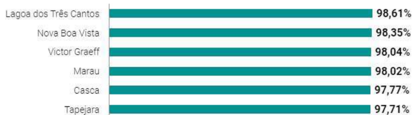
Acima os índices registrados na microrregião. Ao lado os melhores índices do estado do Rio Gande do Sul