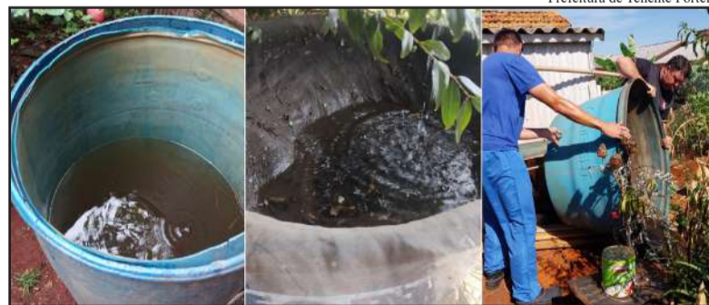
Prefeitura de Tenente Portela

O Centro Estadual de Vigilância em Saúde confirmou nesta quarta-feira (22) mais quatro óbitos em decorrência da dengue no Rio Grande do Sul este ano. Trata-se de três mulheres e um homem, todos com comorbidades. Ambos eram da região Noroeste, sendo uma mulher de Sede Nova.