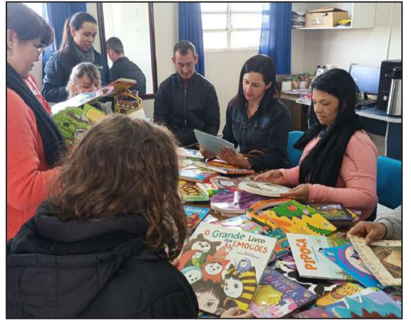
Livros serão usados por alunos do ensino infantil e fundamental

A Administração Municipal, através da Secretaria Municipal de Educação e Cultura, adquiriu na semana passada 728 livros de literatura destinados à Educação Infantil e ao Ensino Fundamental da Rede Municipal. A iniciativa visa promover a leitura em sala de aula, em casa e em atividades de contação de histórias, beneficiando diretamente centenas de estudantes.