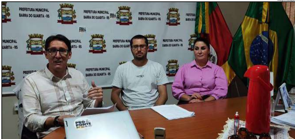
Prefeito e equipe fizeram anúncio pelas redes sociais da prefeitura

O município de Barra do Guarita divulgou ontem a aprovação de uma nova série de obras de asfaltamento, que contemplarão diversas ruas da cidade. Entre as vias selecionadas estão as Ruas Santiago, Claudio Borges dos Santos (próxima ao estádio municipal)