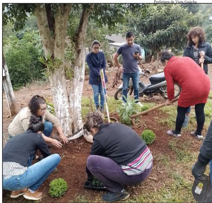
Prefeitura de Vista Gaúcha