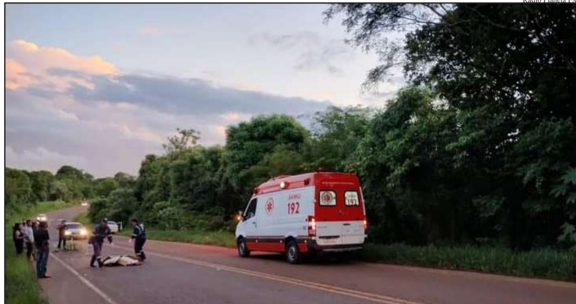
A mortes de indígenas, vítimas de atropelamentos virou corriqueira na rodovia