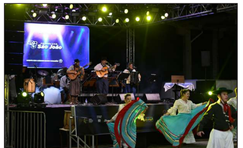
Grupo de cultura Gaudérios se apresentou na abertura do evento

A FEICAP é um evento importante para a região, proporcionando entretenimento, cultura, oportunidades de negócios e celebração.