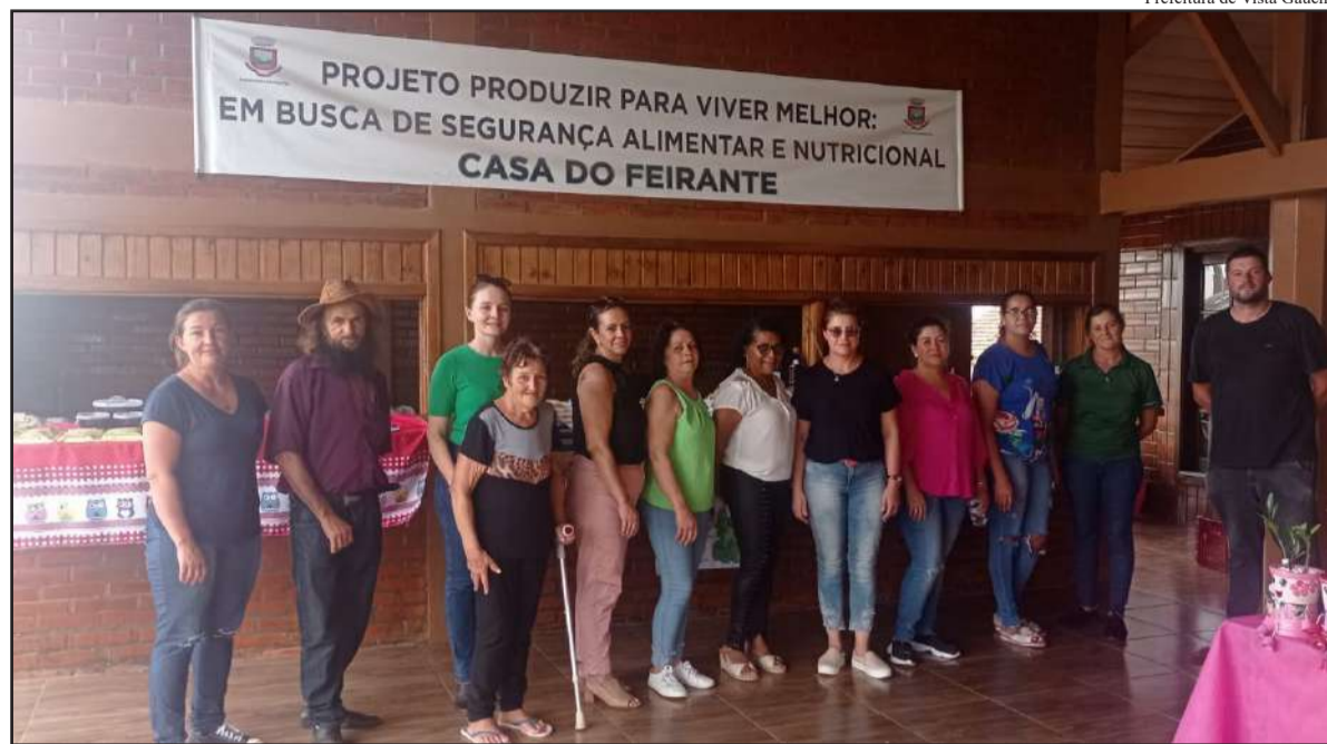
Prefeitura de Vista Gaúcha

Projeto em Vista Gaúcha funciona desde 2017