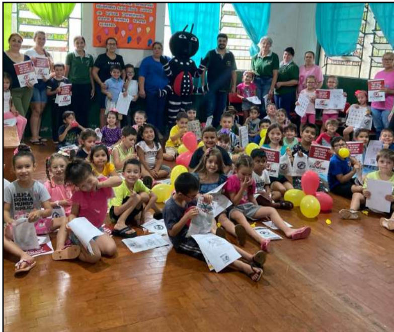
Palestra sobre dengue nas escolas municipais

A equipe da Vigilância Epidemiológica, da Secretaria Municipal da Saúde (SMS), cumpriu roteiro de palestras sobre a dengue em educandários da rede de ensino de Coronel Bicaco.