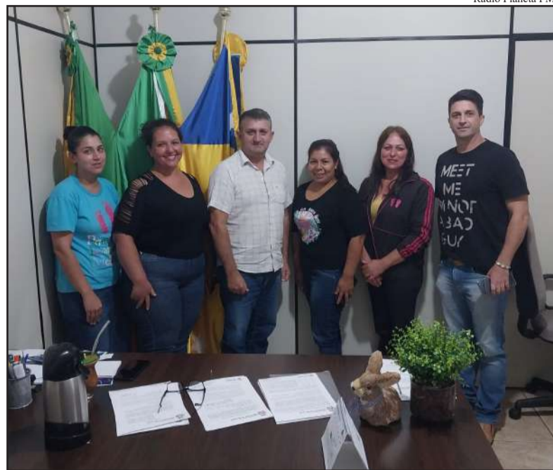
Rádio Planeta FM

Anúncio foi feito pelo prefeito de Miraguaí