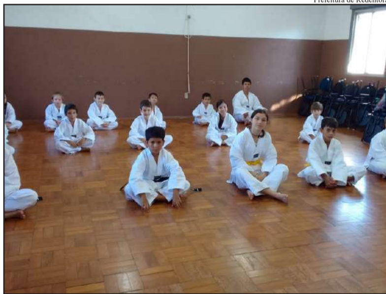
Prefeitura de Redentora

As Crianças e adolescentes foram recebidos com lanche, brincadeiras, brindes e fala da coordenadora e profissionais do CRAS dando as boas-vindas a todos, orientando sobre os diversos serviços disponíveis no CRAS e as oficinas que serão