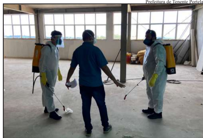
Portela tem um dos maiores índices de casos de dengue do Brasil

Nesta sexta-feira, 22, a Prefeitura de Tenente Portela deverá divulgar um novo boletim onde os casos de dengue confirmados no município deverão chegar aos 3200. O último boletim divulgado na terça-feira tinha 3.135 casos confirmados. Eram 14 casos descartados, 4 óbitos oficializados e 14 pessoas que estavam internadas em decorrência da doença.